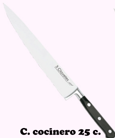
C. cocinero 25 c.