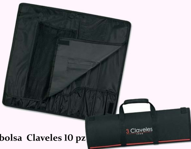
bolsa Claveles 10 pz