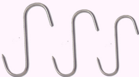
gancho carnicero 14,18,20c.