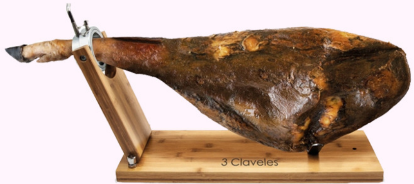
jamoneiro 3 Claveles