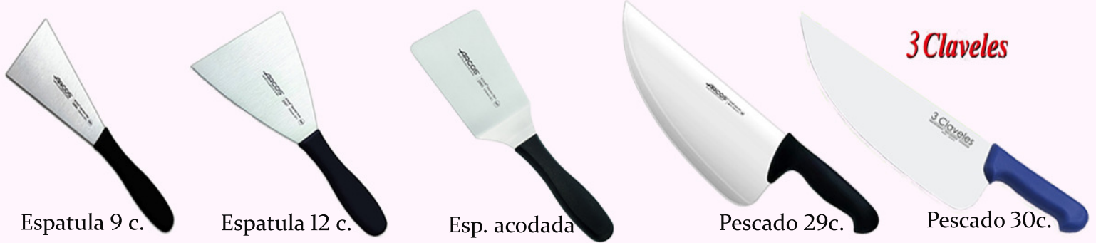
Espatula 9 c. Espatula 12 c. Esp. acodada. Pescado 29c. Pescado 30c.