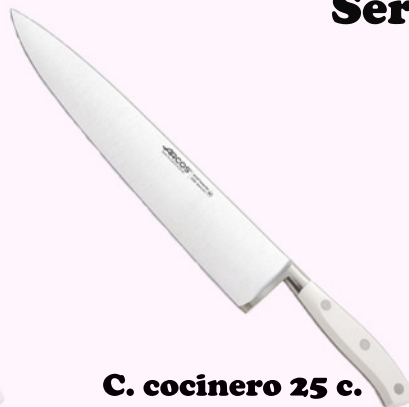
C. cocinero 25 c.