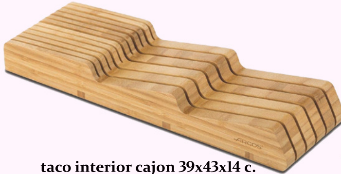
taco interior cajon 39x43x14 c.