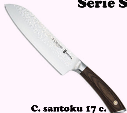
C. santoku 17 c.