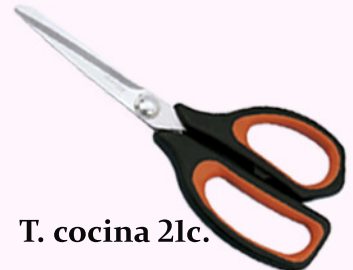
T. cocina 21c.