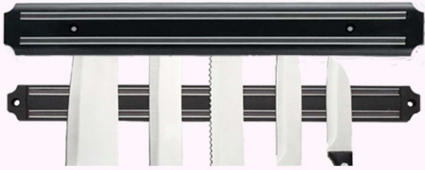
iman 55 cm.