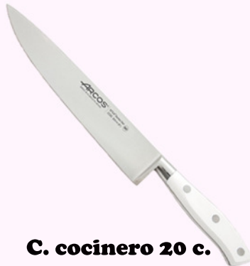
C. cocinero 20 c.