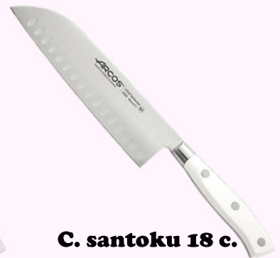
C. santoku 18 c.