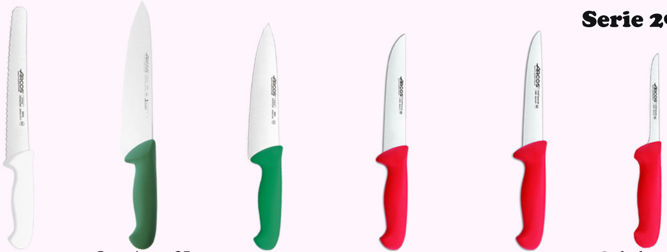
C. pastelero 25c. C. cocinero 25c. C. cocinero 20c. C. carnicero 18c. C. carnicero 18c. C. deshuesdor 14c.