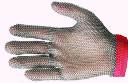
guante malla TM. guante malla TL