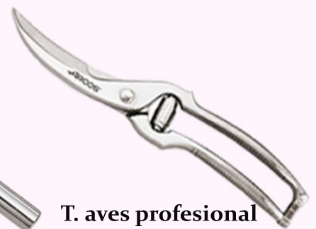
T. aves profesional