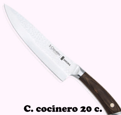
C. cocinero 20 c.