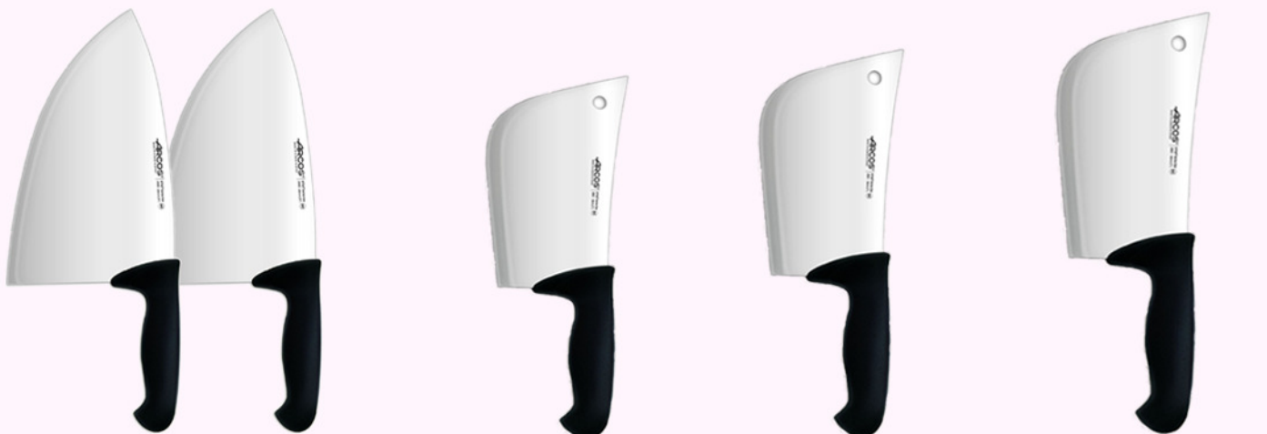
Filetera 26c. 520g. Filetera 26c. 700g. Macheta 19 c. Macheta 22 c. Macheta 25 c.