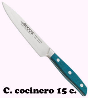
C. cocinero 15 c.