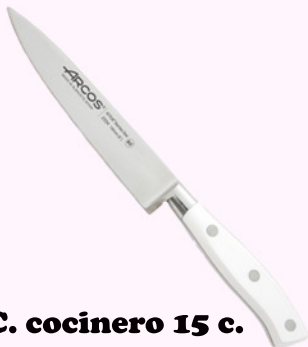
C. cocinero 15 c.