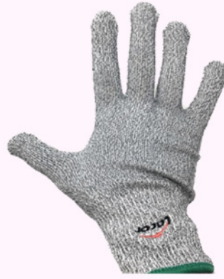
G. proteccion TM. G. proteccion TL.