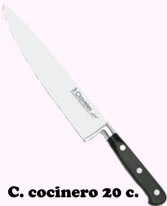
C. cocinero 20 c.