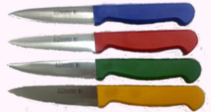
c. verduras 3 Claveles