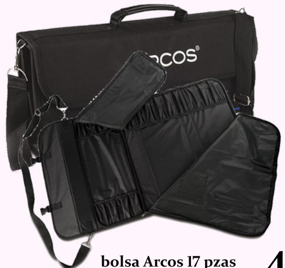
bolsa Arcos 17 pzas