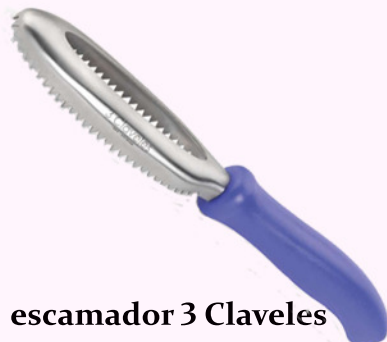
escamador 3 Claveles