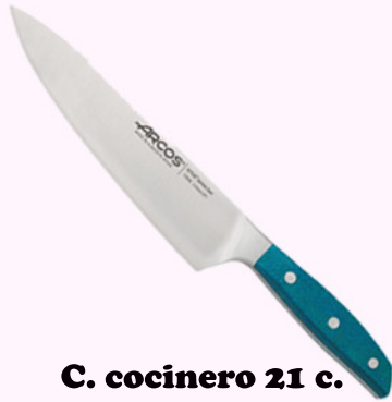
C. cocinero 21 c.