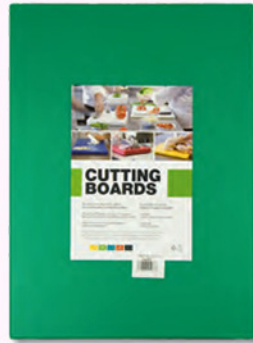
tabla 40x30x2 c. azul/marron/verde tabla 50x40x2 c. azul/marron/blanca