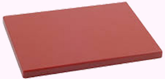
tabla 50x40x3 c.