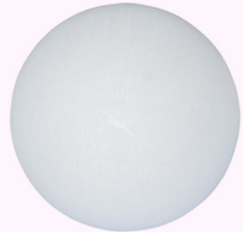
tabla redonda 30 c.