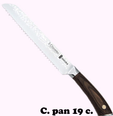
C. pan 19 c.