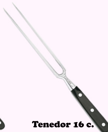
Tenedor 16 c.