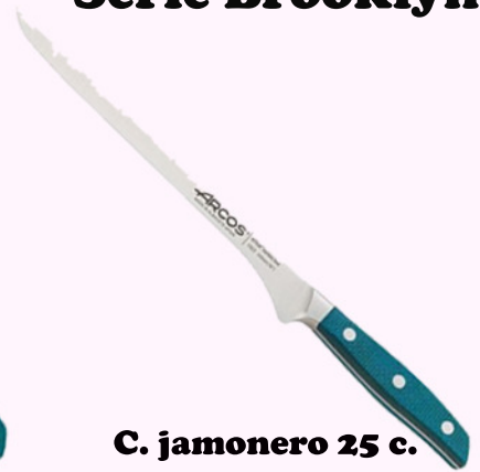
C. jamonero 25 c.