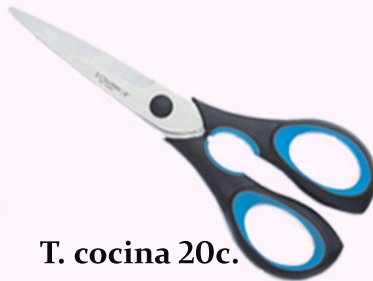
T. cocina 20c.