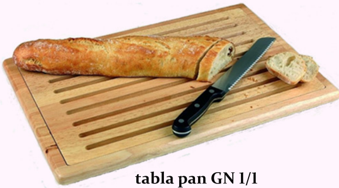
tabla pan GN 1/1