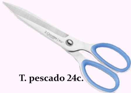
T. pescado 24c.