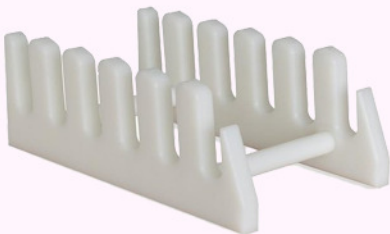
soporte tablas 2 c.