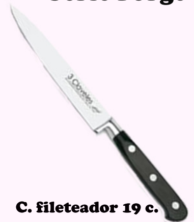
C. fileteador 19 c.