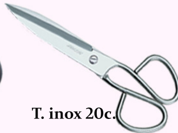
T. inox 20c.