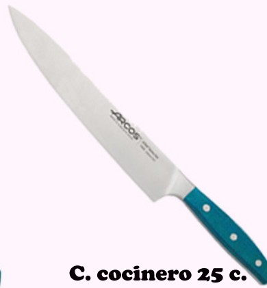
C. cocinero 25 c.