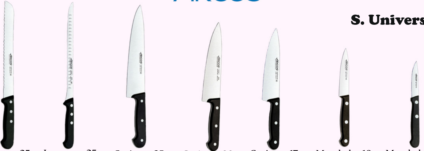
Panero 25c. Jamonero 25c. Cocinero 25c. Cocinero 20c. Cocinero 17c. Mondador 10c. Mondador 7,5c.